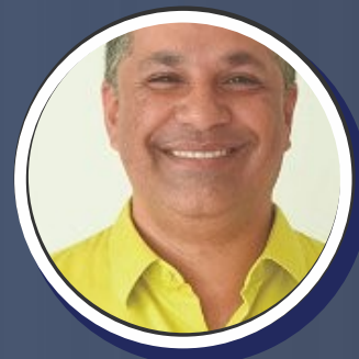
JUNIOR DA SAÚDE 1º SECRETÁRIO