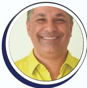
Junior da Saúde

Localização: Gabinete 03 - Sede da Câmara