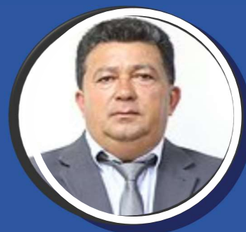
DEMIR 2º SECRETÁRIO