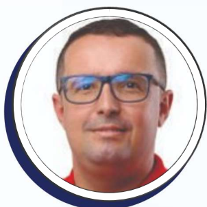
Baiano do Povo

E-mail: camara@taquaritingadonorte.pe.leg.br